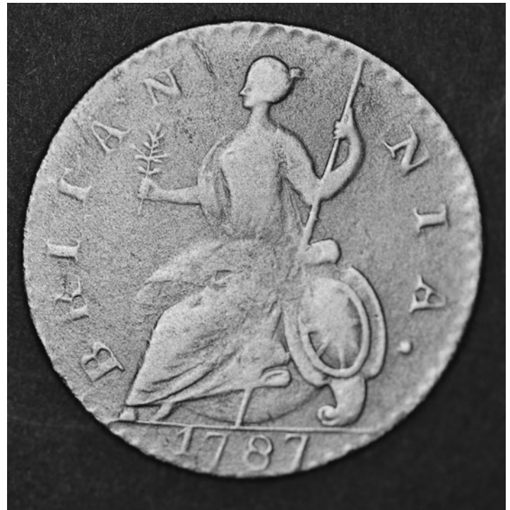
Pièce de monnaie GEORGIVS III. REX BRITANNIA 1787. Musée du Fort Saint-Jean.