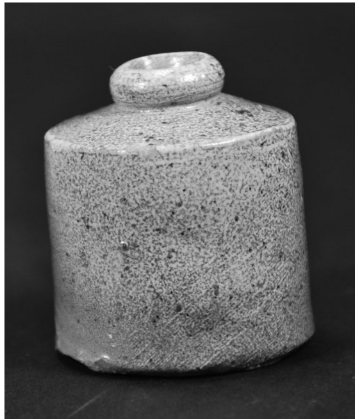
Encrier de grès (ca 1800-1875). Musée du Fort Saint-Jean.